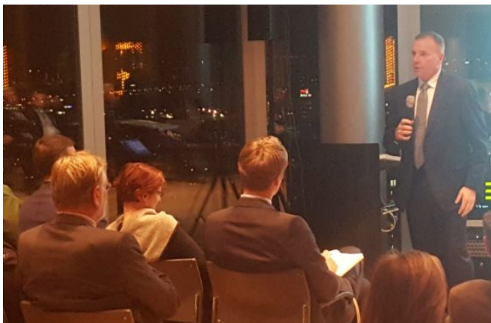
VON KLAUS KELLE • 15. FEBRUAR 2018 • POLITIK STORY, RESSORT POLITIK •

WIRTSCHAFT POLITIK LEBEN GESUNDHEIT KULTUR SPORT GLAUBEN